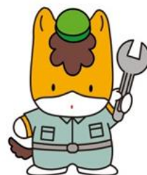
群馬県のマスコット 「ぐんまちゃん」